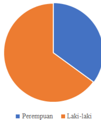
Tingkat Managerial Di Indonesia Pada Tahun 2023